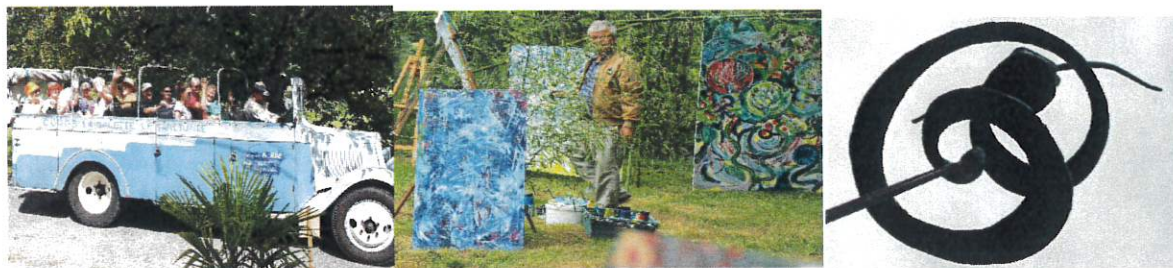
Les arts au jardin 13 et 14 juillet 2024